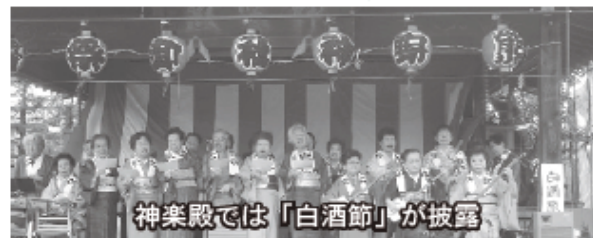
神楽殿では「白酒節」が披露