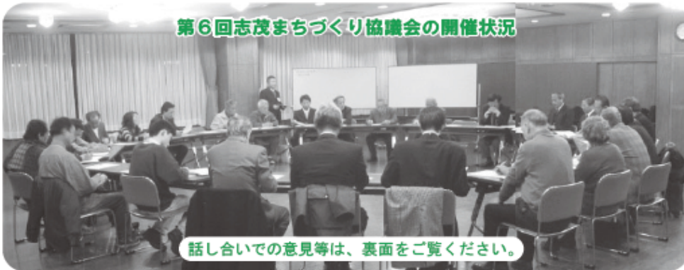
第6回志茂まちづくり協議会の開催状況