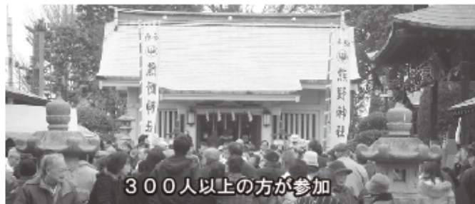
300人以上の方が参加