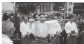
甘酒も振る舞われ