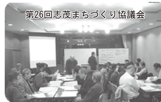
第26回志茂まちづくり協議会

平成22年11月16日(火)志茂まちづくり協議会(第26回)において、公園プランづくりの会(ワークショップ)から報告のあった(仮称)志茂3丁目公園整備計画(原案)を、話し合いの結果承認し、区へ提案しました。