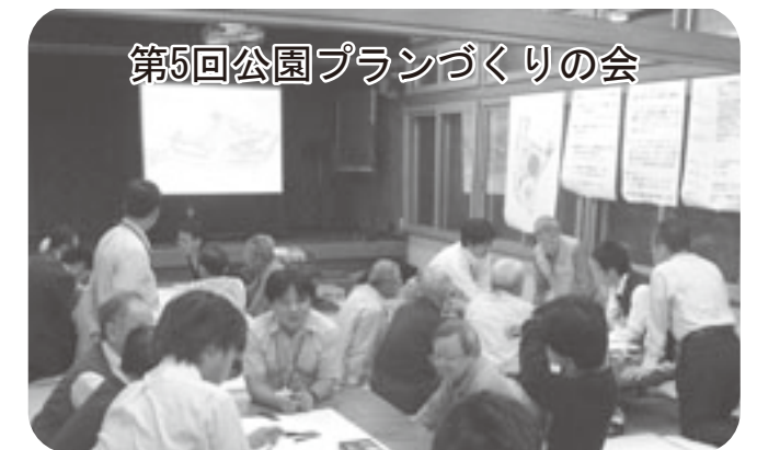
第5回公園プランづくりの会